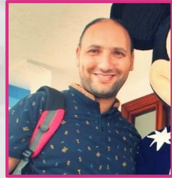
رئيس التحرير : عاده العلمي

"الإغاثي" ، مولود إعلامي جديد ينضاف إلى سلسلة إصدارات الجمعية المغربية للإغاثة المدنية، جسر نريد له أن يكون صلة الوصل بين كل الإغاثيين أولا بكل ربوع الوطن الحبيب، و بين الإغاثيين و المجتمع ثانيا أملا في تأكيد الحضور القوي لأنشطة الجمعية، و تعزيزا للصورة الذهنية الإيجابية لدى كل من خبير الميدان مع هؤلاء الشباب المعطاء و الخدم.. "الإغاثي"، لن تكون فقط لسان حال المكتب المركزي، بقدر ما ستكون لسان حال كل أبناء الإغاثة، و سنحاول في هيئة التحرير ما أمكن أن نصل إلى كل الفروع لنغطي الأنشطة التي ينظمونها، و سنحاول ما أمكن أن تقدم هذ المجلة بالإضافة النوعية تربويا ..