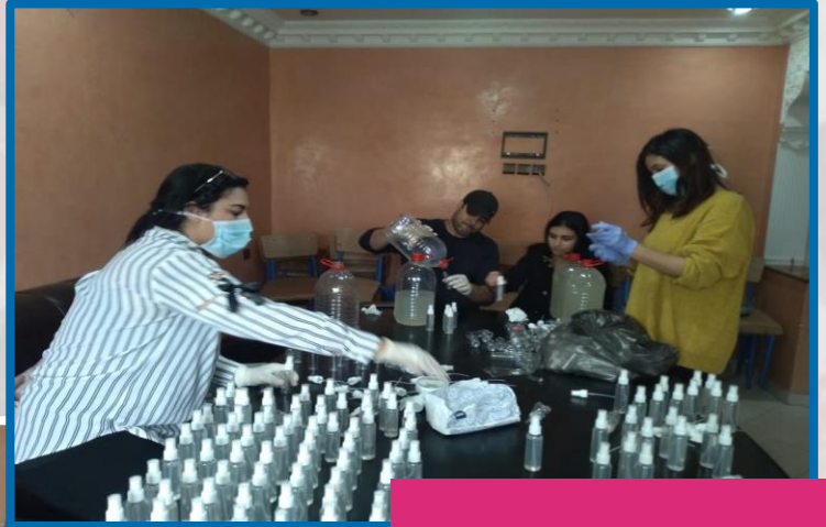
خلية اليقظة و التعبئة