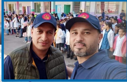
قيادة لجنة الطوارئ