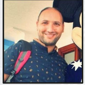
رئيس التحرير : عادل العلمي

عدد ليس ككل الأعداد، قد يكون محتواه بسيطا حجما، لكنه مليء بالمشاعر الفياضة، لم أحسني يوما ملزما وراغبا ومتحمسا لإخراج عدد إلى الوجود، مثلما أنا عليه اليوم، ربما هي رغبتني في أن أتقدم بالشكر والامتنان لكل الإغاثيين في كل ربوع الوطن على ما قدموه خلال فاجعة زلزال الحوز، كنتم بحق رجال ونساء هذا الوطن، وتستحقون أن نوشحكم بوشاح الشرف والوطنية الحقة ..