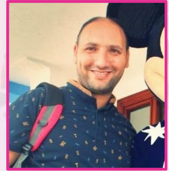
رئيس التحرير : عادل العلمي

ببلوغ مجلة الإغاثي العدد الرابع، نكون قد حققنا الهدف المرسوم لهذه السنة، سنة استثنائية بكل المقاييس، لكنها سنة إنتاج و عطاء زاخر..