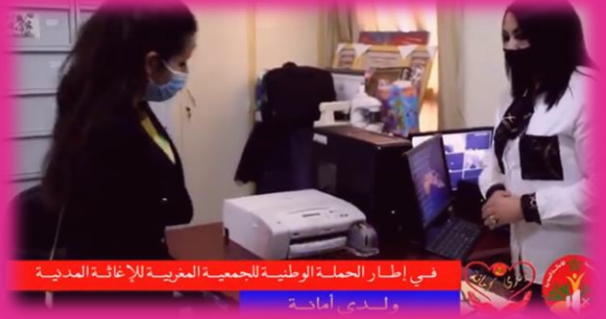
في إطار الحملة الوطنية للجمعية المغربية للإغاثة المدنية والعمرانية

مساهمة منها في الحملة الوطنية «ولدي أمانة»، أنتجت المفوضية الجهوية للجمعية بفاس مكناس كبسولة تحسيسية حول الموضوع ..